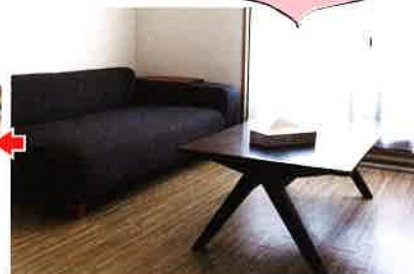
Seria 壁ピタティッシュ