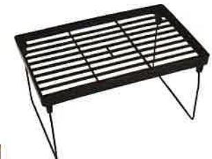
Seria シンク下整理棚 Sブラウン