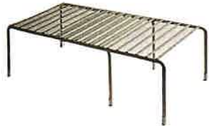
ニトリ スライド整理棚 (WH)