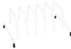
ダイソー ディッシュスタンド

キッチンの引き出しに食器類を入れていますが、重ねると使いたい食器が取り出しにくかったのに、これがあれば取り出しやすく、使いたい食器がひと目でわかってとても便利です。(Pちゃん。さん)